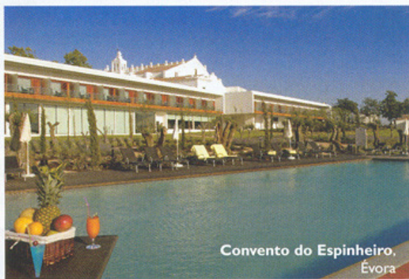
Convento do Espinheiro, Évora

portuguesas. Denominada Convento do Carmo , está localizada num antigo convento das Carmelitas, datado de 1658. Com preços a partir de € 350 por noite, os luxuosos quartos, onde antes eram as celas dos monges, estão decorados num estilo clássico e oferecem serviços especiais (como um mordomo, para quem optar pelas instala-