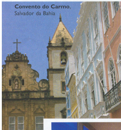
Convento do Carmo, Salvador da Bahia