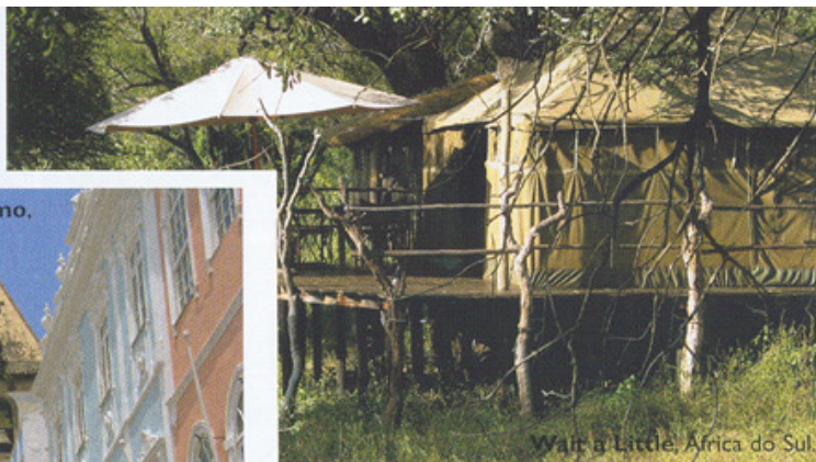
Wait a Little, África do Sul

misto de elegância e modernidade. O hotel proporciona um serviço de spa exclusivo de Paul LaBrecque no quarto do hóspede, em que pode optar por massagens, reflexologia, tratamentos corporais ou de beleza,