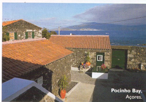
Pocinho Bay, Açores.