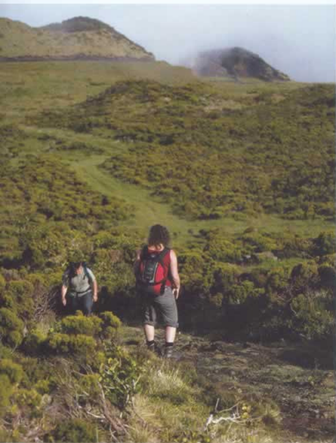
Momento do percurso até ao topo do Pico (em cima); a piscina do Pocinho, iluminada ao anoitecer, e o pequeno-almoço, um dos pontos altos da estada (na pág. ao lado)

de Lava" é o melhor exemplo, além do "Lajido", mais forte e adocicado, herdeiro directo do antigo "verdelho" picoto. Os néctares encontram-se à venda na cooperativa; aproveite, pois dificilmente os encontrará no continente. Após quase se ter tacteado o céu e degustado as riquezas que brotam da terra, resta o mar por conhecer – até porque na Primavera e Verão a costa do Pico faz parte da trajectória migratória de cerca de 24 espécies de baleias e golfinhos. Nas Lajes encontram-se várias empresas de "Whale Watching", entre as quais o Espaço Talassa, pertencente ao pioneiro da actividade no arquipélago, Serge Viallelle. As probabilidades de avistar os cetáceos, perseguidos e caçados nos mares dos Açores até meados dos anos 80, é real e promete grandes descargas de adrenalina. Depois, é só regressar ao Pocinho Bay e lembrar que o silêncio é o maior convite ao descanso. Pelo menos até à "hora dos cagarros". ☐