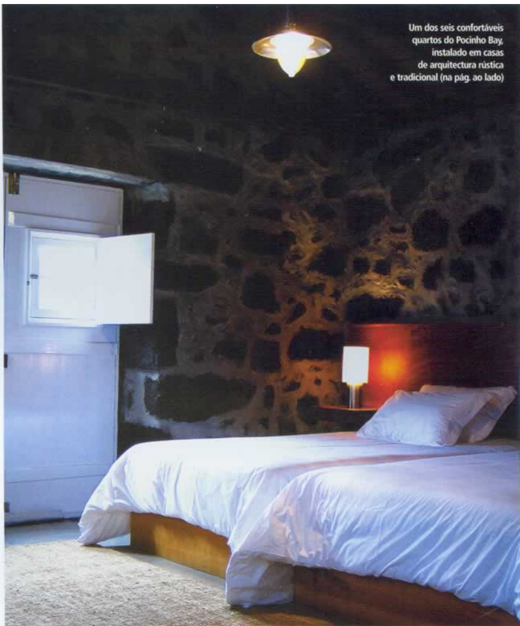
Um dos seis confortáveis quartos do Pocinho Bay, instalado em casca de arquitectura rústica e tradicional (na pág. ao lado)

C om a noite desce o silêncio, apenas profanado pelas conversas de sedução entre os cagarros à beira-mar. A praia, quando o Sol se põe, pertence a estes estranhos pássaros, que têm nos Açores o seu habitat de eleição. Dizem que os cagarros mantêm o par para toda a vida, assim como o lugar que escolhem,